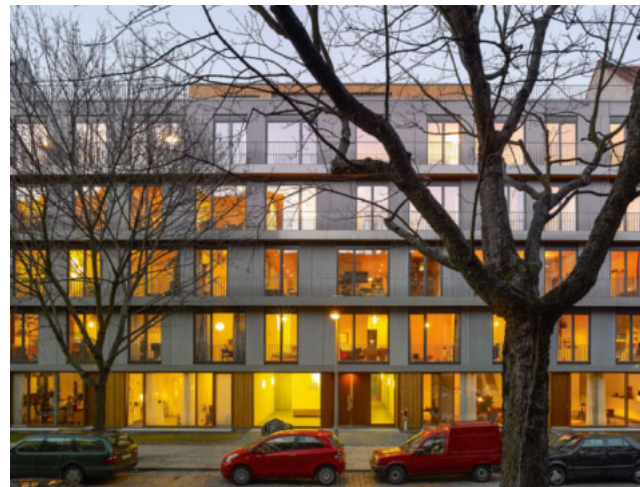
Projekt 3xgrün, Berlin (2010)