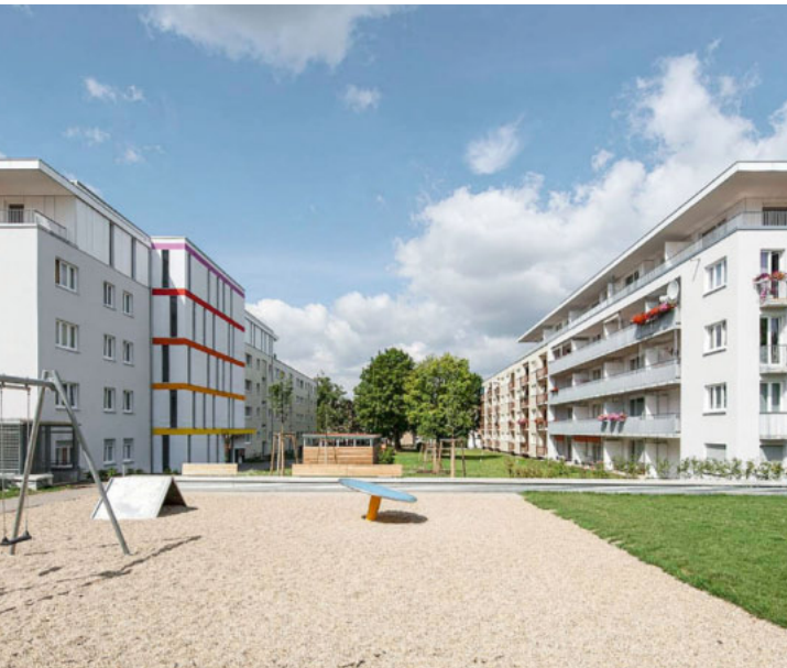
Konradsiedlung, Regensburg (2009)

Das Potenzial an Wohnraumgewinnung ist enorm: so könnten auf diese Weise 1,5 Mio. neue Wohnungen durch Aufstockungen hinzugewonnen werden.