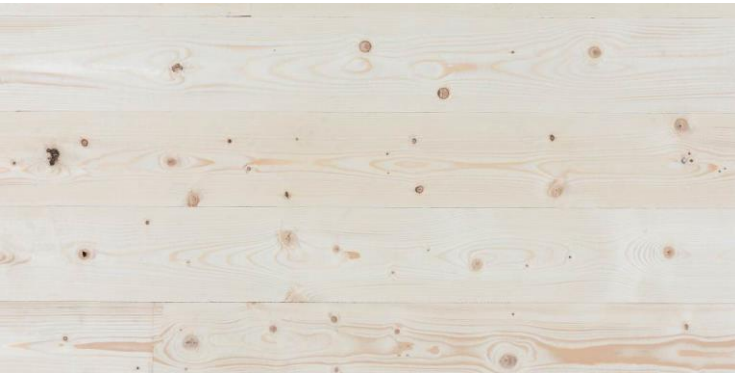
Abbildung 2: Oberfläche Industriesicht-Qualität