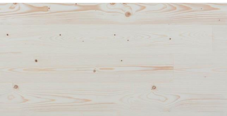
Abbildung 3: Oberfläche Nordische Auslese