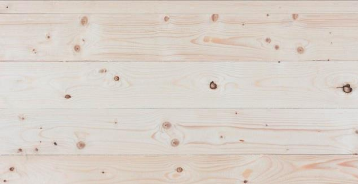
Abbildung 1: Oberfläche Industrie-Qualität